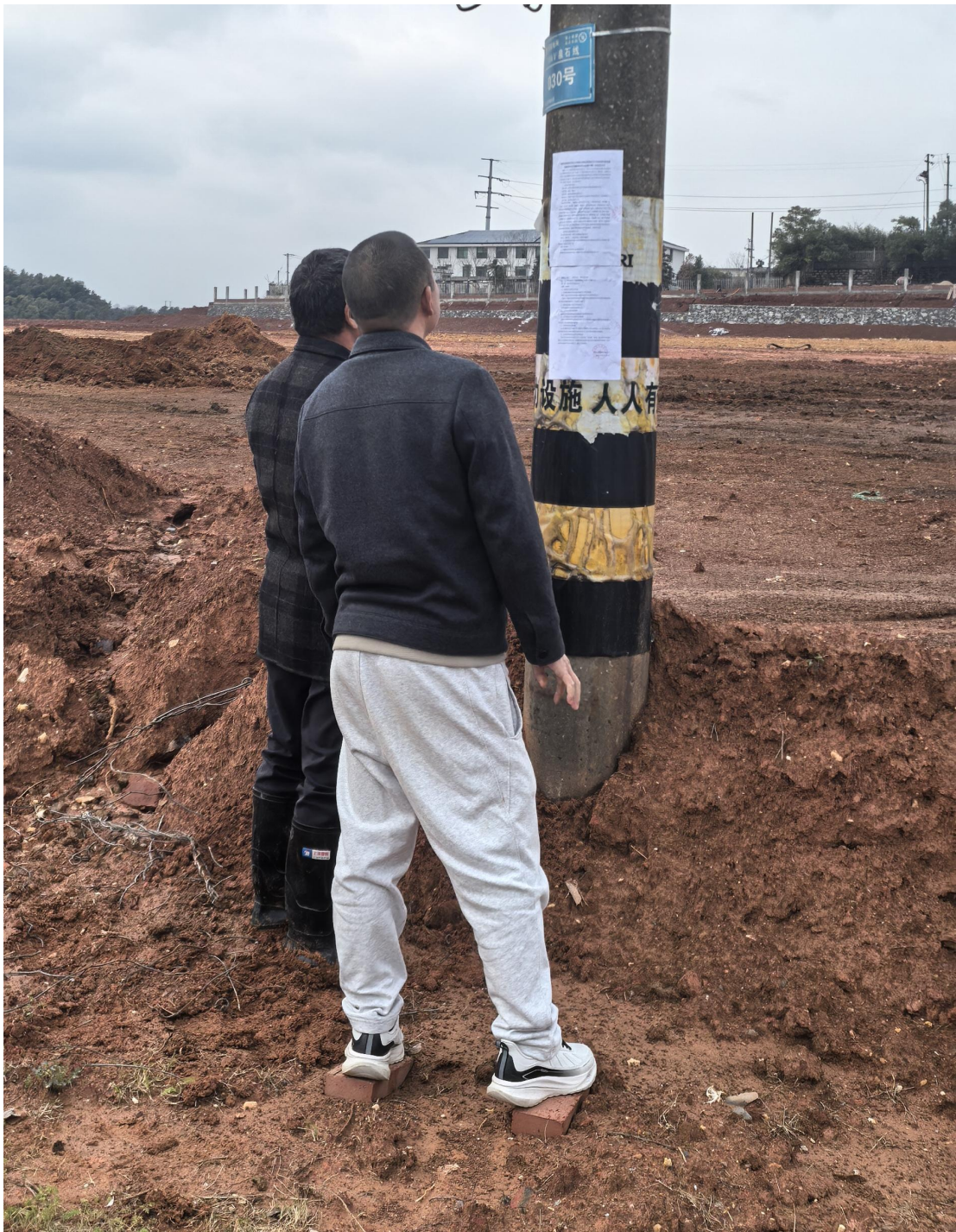
图 3-4 现场张贴公示照片