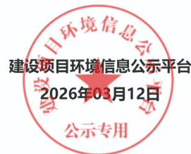
图 3-1 征求意见稿环境影响评价信息网络公开截图