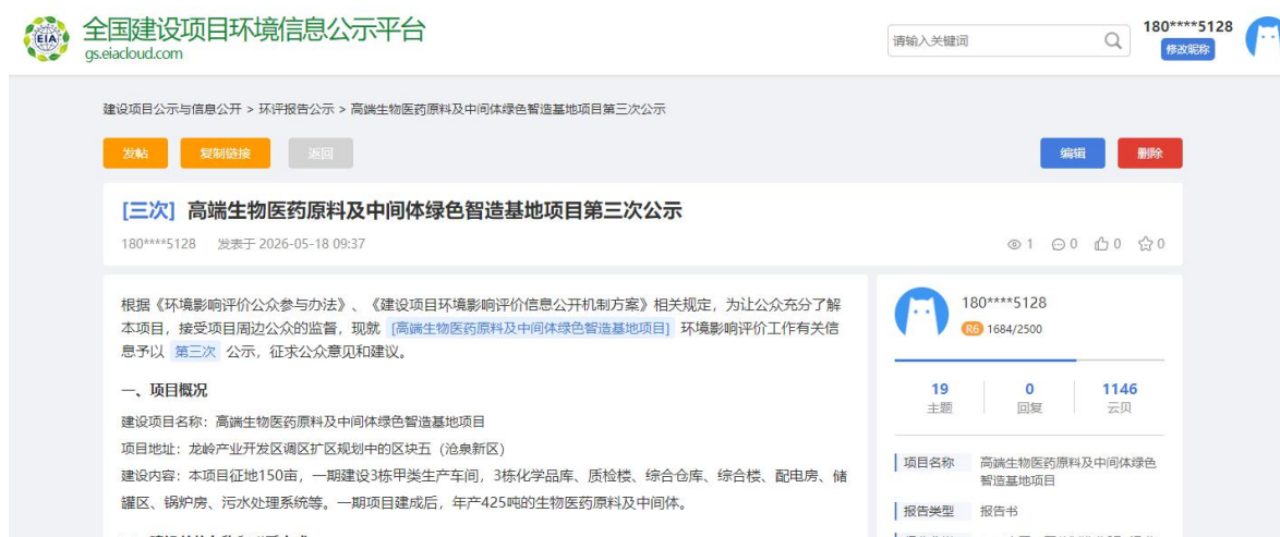
图 6-1 报批稿网络公示截图

https://www.eiacloud.com/gs/detail/1?id=60518KrYF3 ，公示内容见图 6-1：