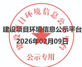
图 2-1 第一次环境影响评价信息网络公开截图