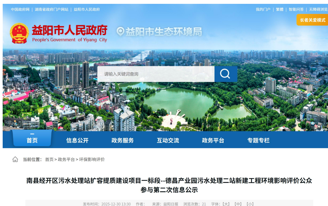
图 2 第二次网上公示截图

示。第十一条规定公开的信息的方式之一是通过网络平台公开，且持续公开期限不得少于 10 个工作日。因此建设单位在益阳市生态环境局官网上进行了此项目的第二次网上公示，公开网址为 https://www.yiyang.gov.cn/yyshjbhj/3452/3467/content_2149676.html ，公示截图见图 2 所示。因此，公开载体的选取是符合《环境影响评价公众参与办法 生态环境部令 第 4 号》第十一条的规定。