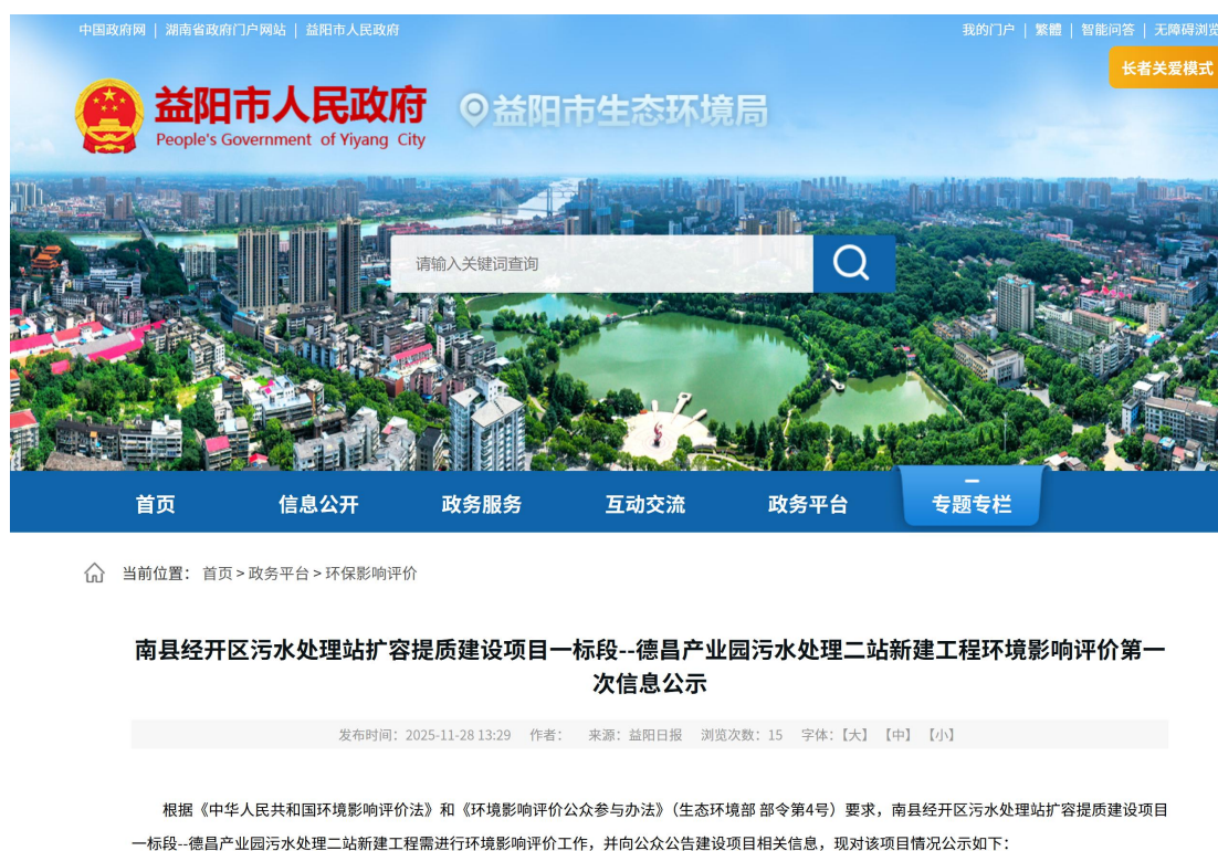
图 1 第一次网上公示截图

单位应当在确定环境影响报告书编制单位后 7 个工作日内，通过其网站、建设项目所在地公共媒体网站或者建设项目所在地相关政府网站（以下统称网络平台）公开相应信息。因此，南县工业园区建设开发有限责任公司在 2025 年 11 月 24 日委托湖南沐程生态环境工程有限公司后的 7 个工作日内，2025 年 11 月 28 日在益阳市生态环境局官网进行了此项目的第一次公示。公开网址为 https://www.yiyang.gov.cn/yyshjbhj/3452/3467/content_2149675.html ，公示截图见图 1 所示。公开载体的选取也符合《环境影响评价公众参与办法 生态环境部令 第 4 号》第九条的规定。