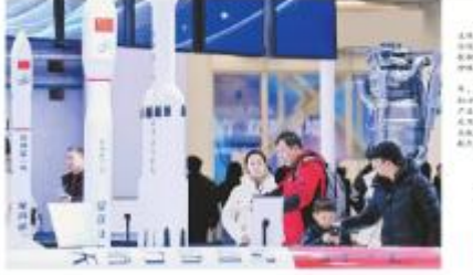
“天天金嗓子”品牌代言人王冰冰在活动现场与小朋友们互动。

办法还明确,出口货物劳务增值税和消费税管理办法包括:出口货物劳务增值税退税率、出口货物劳务消费税退税率、出口货物劳务增值税和消费税退税率计算方法等事项。