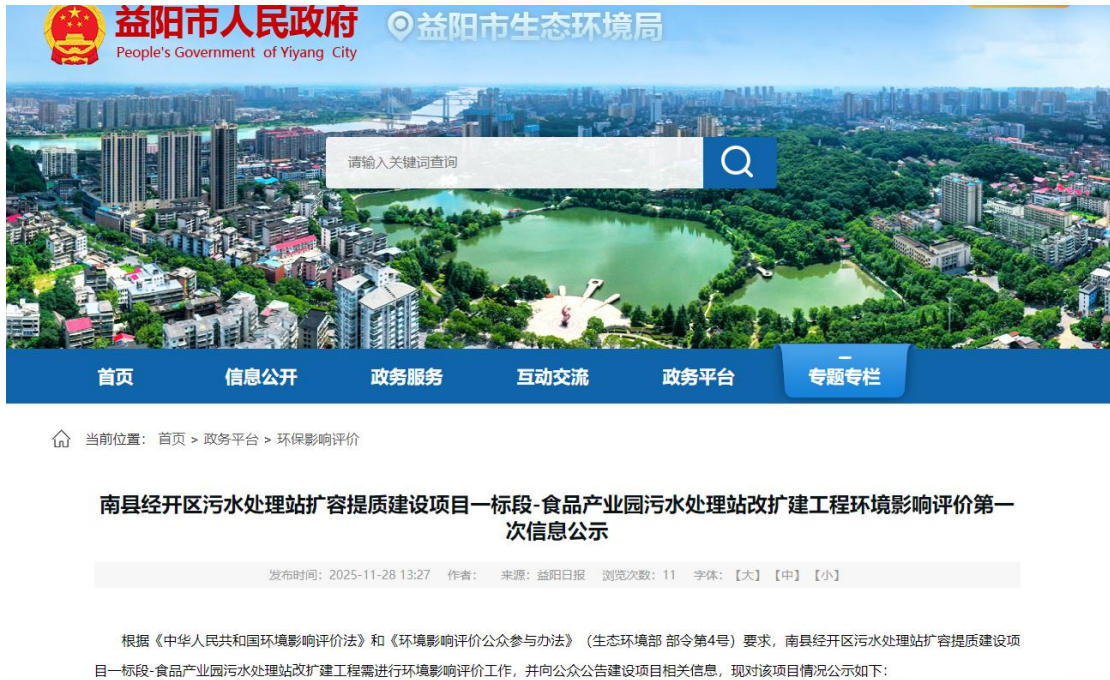
图1 第一次网上公示截图