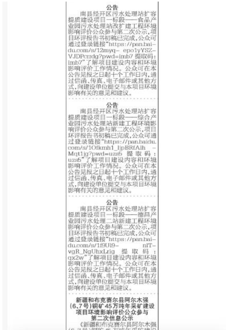
图 5 第二次报纸公示照片