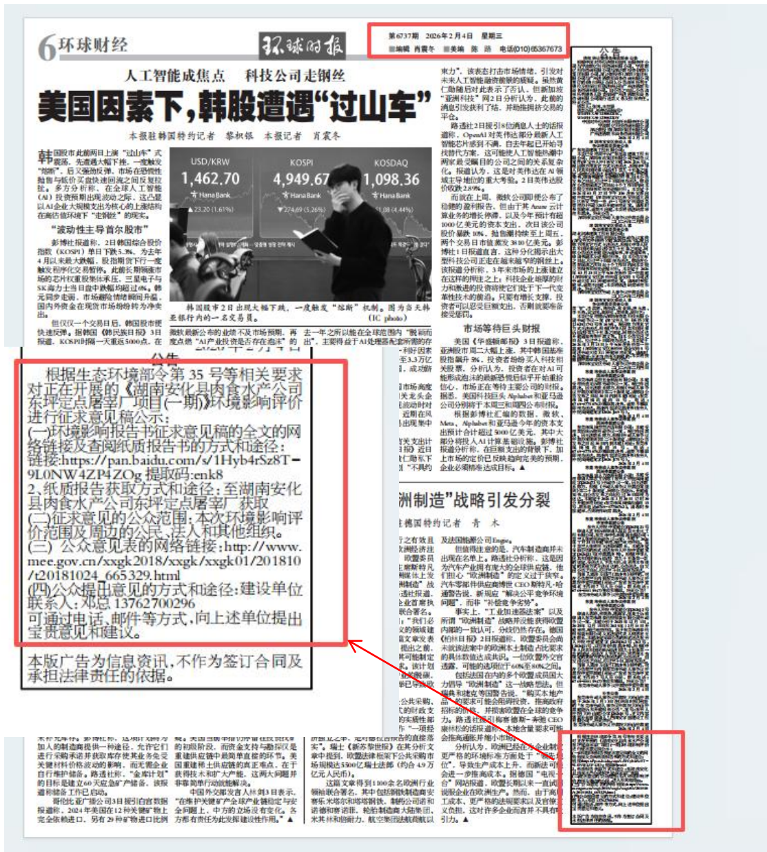
图 4 报纸公示照片（环球时报 2026 年 2 月 4 日）