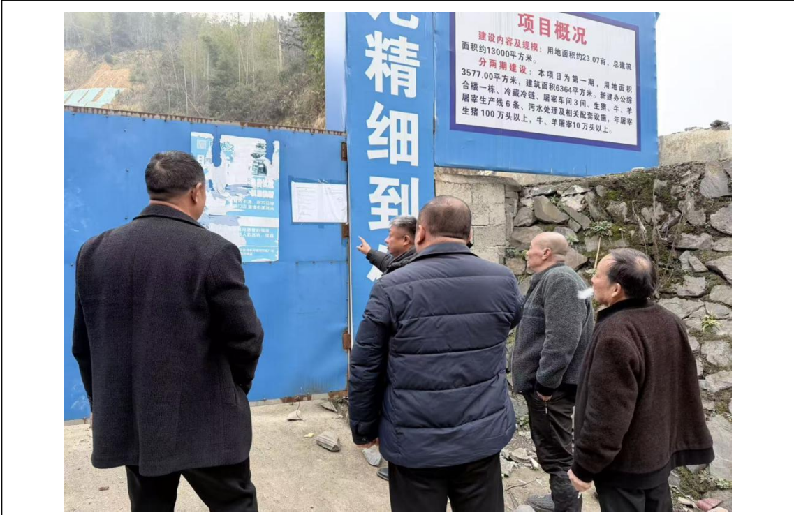
项目所在地公示照片