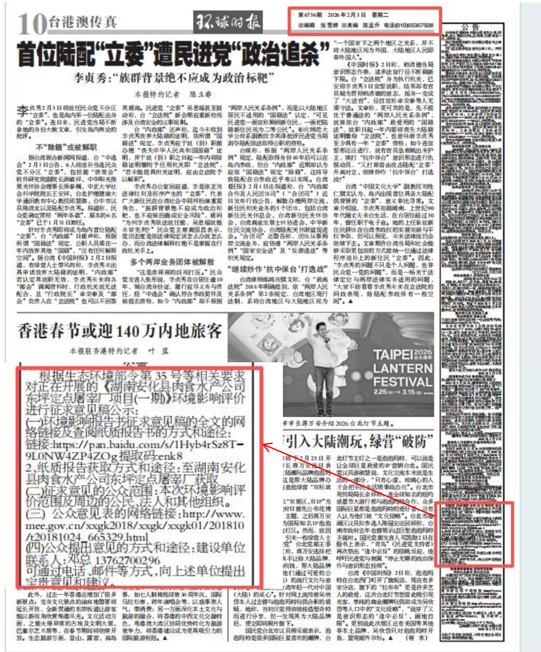
图3 报纸公示照片（环球时报 2026年2月3日）

本项目报纸公示载体为“环球时报”，环球时报公众易于接触，符合《环境影响评价公众参与办法》要求。公示日期为2026年2月3日、2026年2月4日，照片见图3。