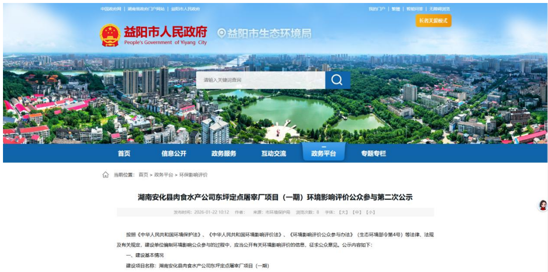
图 2 第二次公示网络截图（公示平台）

本项目第二次公示网络公示载体为“益阳市生态环境局公示平台”，符合《环境影响评价公众参与办法》要求。公示网址为“ http://www.yiyang.gov.cn/yyshjbhj/3452/3467/content_2151752.html ”，公示时间为 2026 年 1 月 22 日~2 月 5 日。截图见图 2。