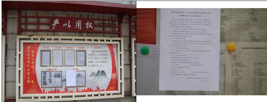
图 3-2 漉湖芦苇场现场张贴公示照片

本次征求意见稿公示信息现场张贴在沅江市麓湖芦苇场公告栏。张贴时间为2025年11月5日。部分现场张贴的照片见图3-2。