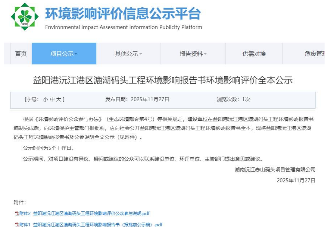
图 4-1 报告书报批前全本公示截图