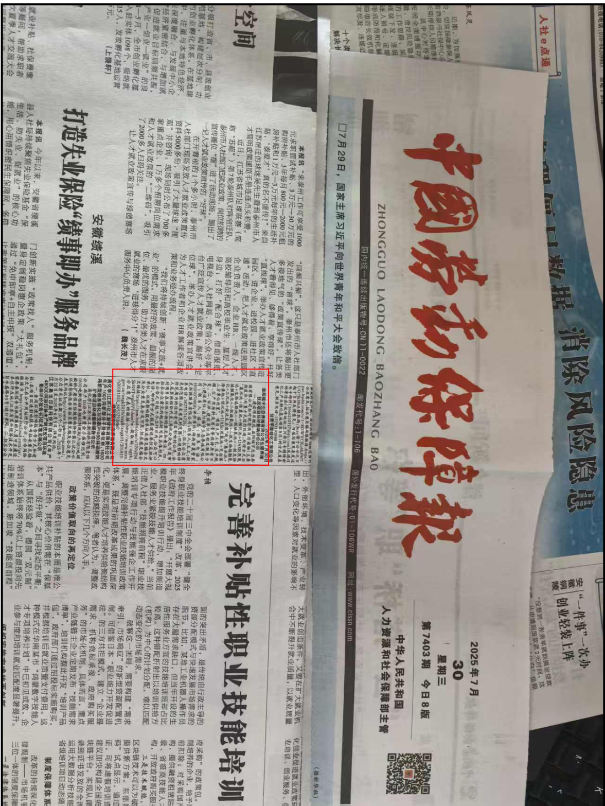
图3.2.3 第二次报纸公示