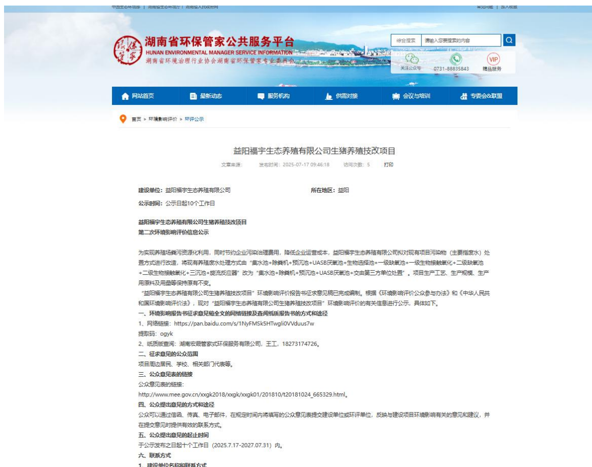
图3.2.1 第二次网络公示

《中国劳动保障报》创办于1985年，是中华人民共和国人力资源和社会保障部主管、中国劳动保障报社主办的以反映国家人事人才工作、劳动和社会保障工作者及广大劳动群众关心的经济与社会问题为主要内容的全国综合性报纸。2018年3月，获“2017年百强报纸”荣誉。 2019年12月7日，荣获中国产经媒体“新媒体影响力指数”进步奖。