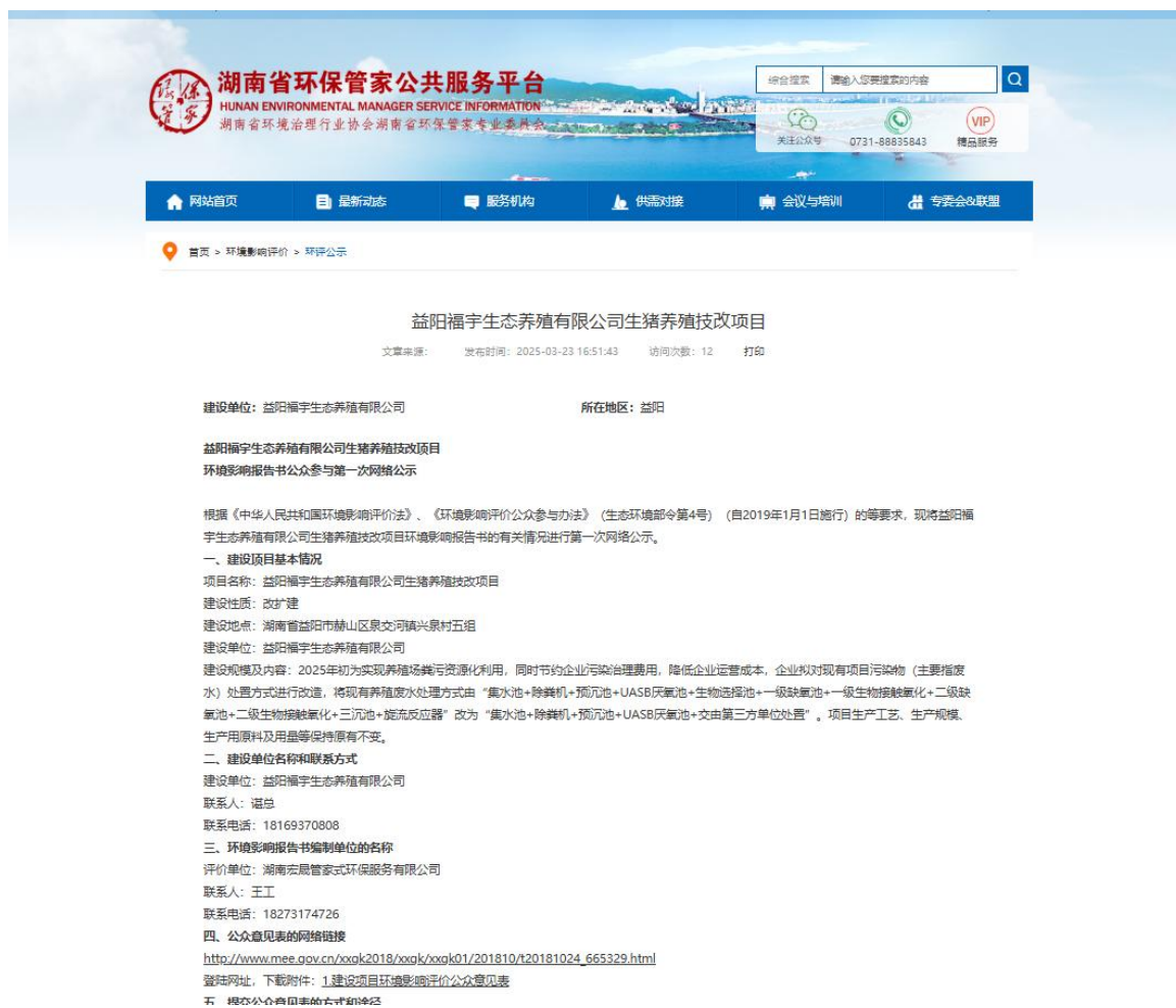
图2.2.1 第一次网络公示