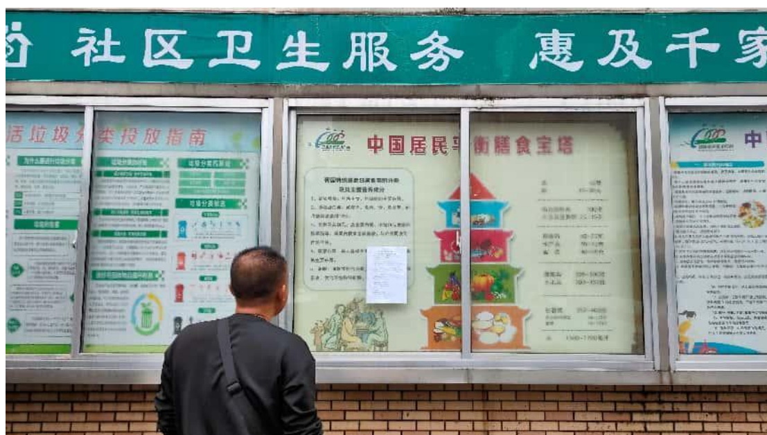
沅江市琼湖街道社区