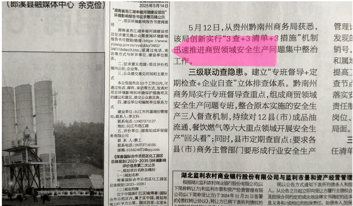
图 3.2-3 国际商报第一次公示照片