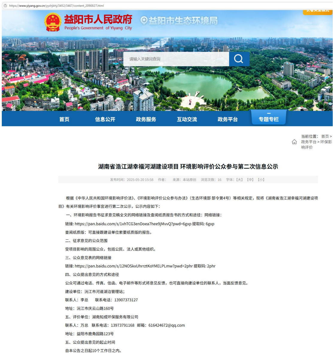
图 3.2-1 第二次环境影响评价信息公开网络公示截图

）进行了网络公示，公示期为 2025 年 5 月 20 日~2025 年 6 月 3 日，其符合《环境影响评价公众参与办法》（生态环境部令部令 2018 年第 4 号）中第十条：通过网络平台公开，且持续公开期限不得少于 10 个工作日的要求；征求意见稿网络公示截图如下图所示。