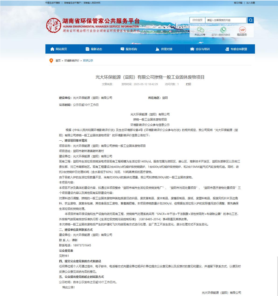
图 1 第一次网上公示截图