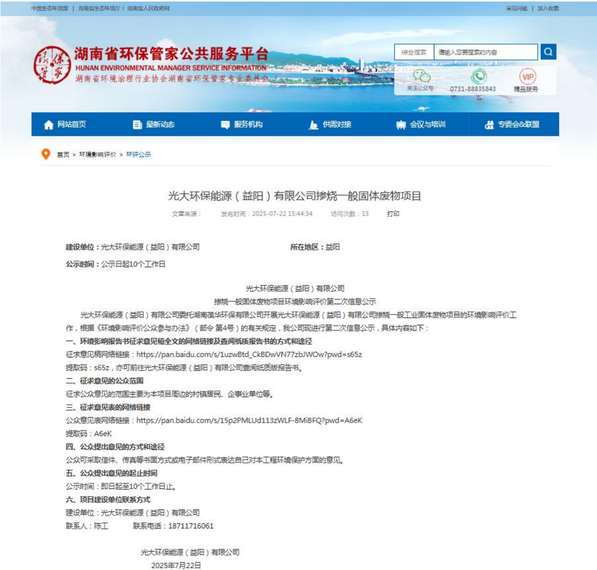
图 2 第二次网上公示截图

上公示（ https://www.hnhbgj.com/eia/gongshi/7641.html ），见图 2。