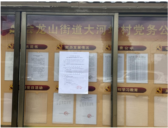
会龙山街道大河坪村

2025 年 7 月 22 日，我公司向项目所在地张贴了第二次环境影响信息公示并发布了征求意见稿的获取方式和公众参与调查表格，见图 5。