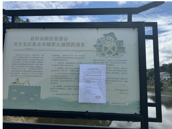
益阳高新区管委会