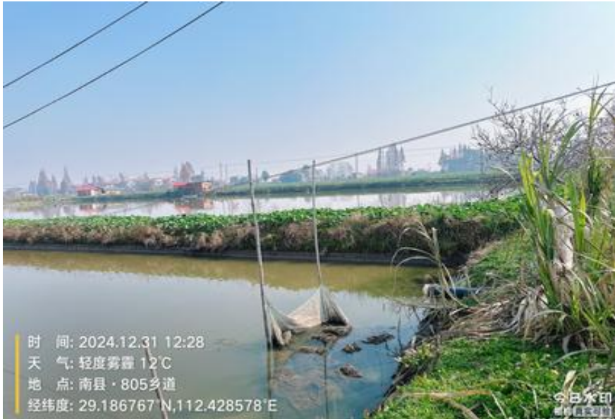
图 3-1 用地现状照片