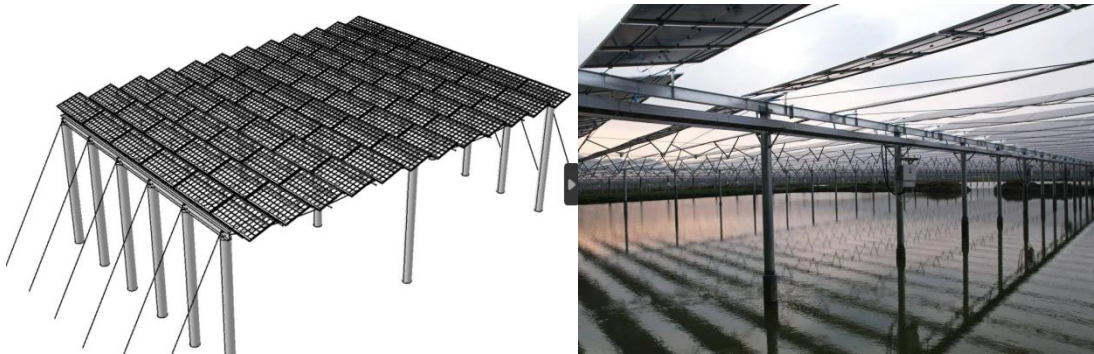
图 2-1 柔性支架光伏方阵的示意图

根据本工程地形条件，光伏支架桩基础施工采用干式施工方式，施工流程为管桩堆放检验——场内驳桩——吊桩、插桩——静压沉桩（达到贯入度、标高要求）——送桩至设计标高——回填桩孔。