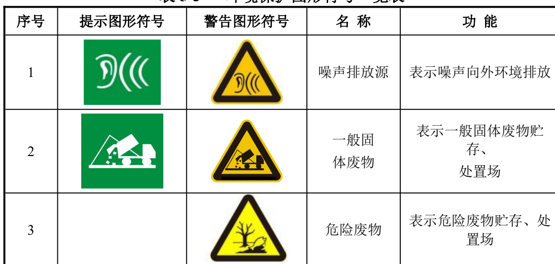
表 5-4 环境保护图形标志的形状及颜色表