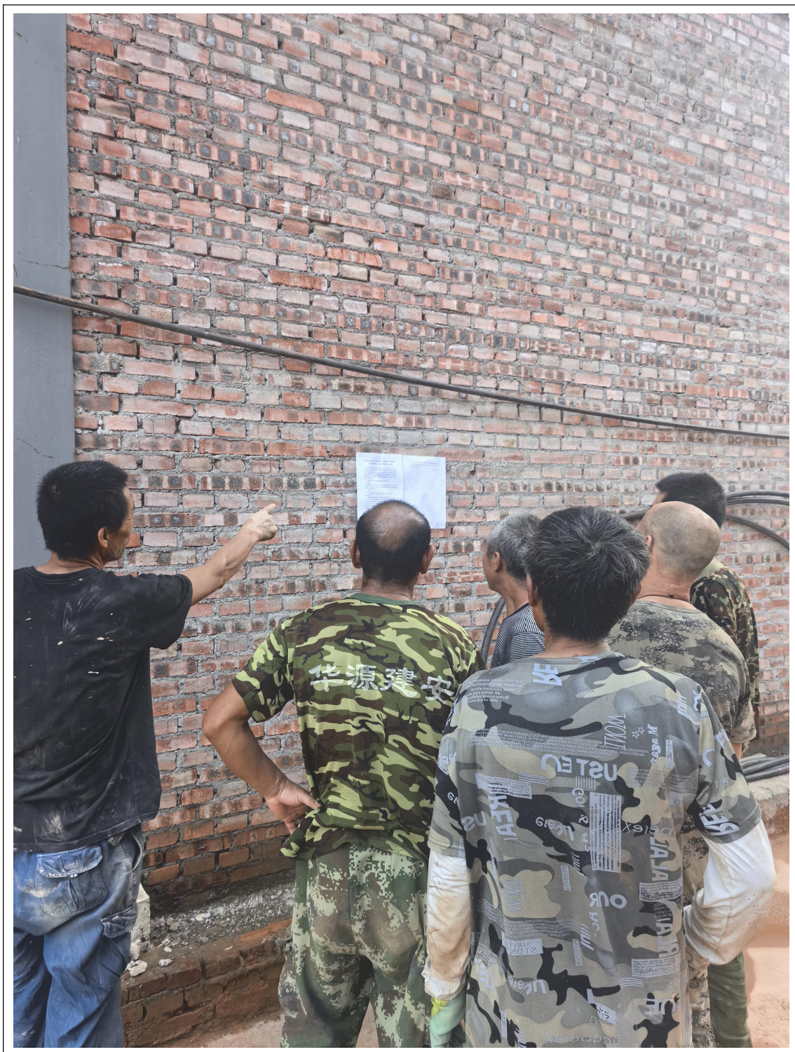
图 3 本项目张贴公告照片

本项目建设单位于 2024 年 6 月 17 日~2024 年 7 月 1 日在项目所在地及其附近张贴现场公示，向公众发布环境信息公告。公示情况见图 3。