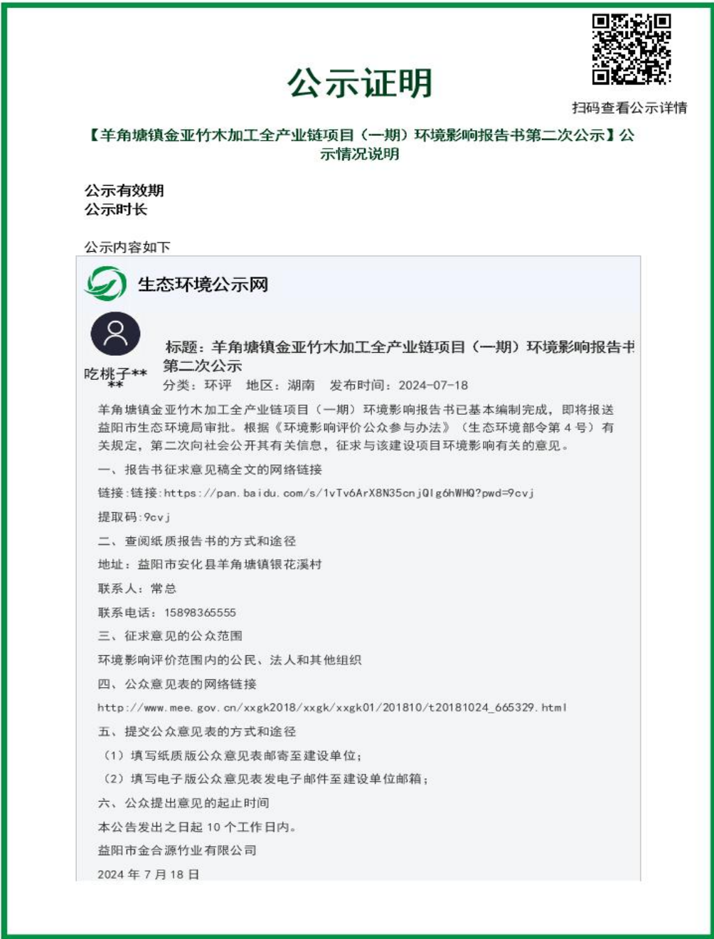
图 2 第二次网上公示截图

建设单位于 2024 年 7 月 18 日在环保小智公示网的网站（ https://gongshi.qsyhbgi.com/h5public-detail?id=346824 ）对本项目的环境保护情况进行了该项目的第二次网上公示。公示内容包括建设项目的简要工程概况，公众查询环评报告书简本、索取补充信息的方式以及期限，征求公众意见的范围和主要事项，建设单位和环评单位的联系方式以及项目简本。公示情况见图 2。