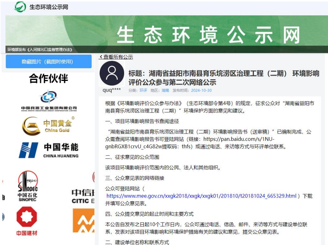
图 2-2 第二次公示网络公示截图