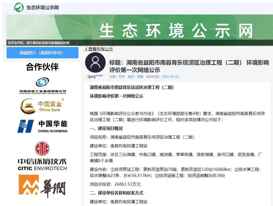
图 2-1 第一次公示网络截图