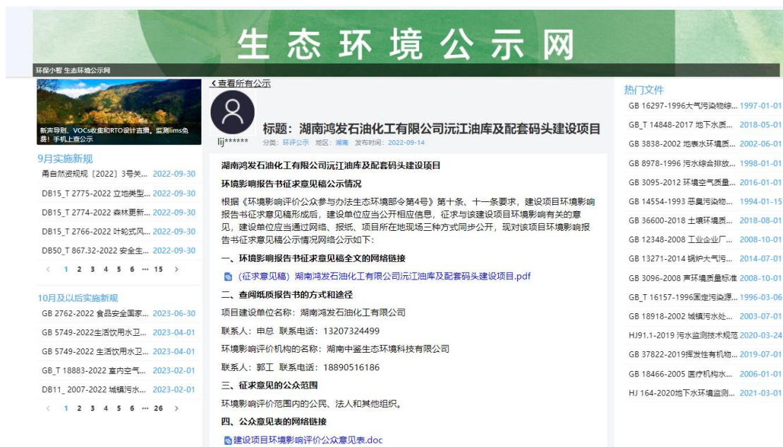
图 2 第二次网上公示截图

根据《环境影响评价公众参与办法 生态环境部令 第 4 号》第十条规定建设项目环境影响报告书征求意见稿形成后,应对征求意见稿及其它相关信息进行公示。第十一条规定公开的信息的方式之一是通过网络平台公开,且持续公开期限不得少于 10 个工作日。因此建设单位在生态环境公示网上进行了此项目的第二次网上公示,公开网址为 https://gongshi.qsyhbgj.com/h5public-detail?id=305785 ,公示截图见图 2 所示。因此,公开载体的选取是符合《环境影响评价公众参与办法 生态环境部令 第 4 号》第十一条的规定。