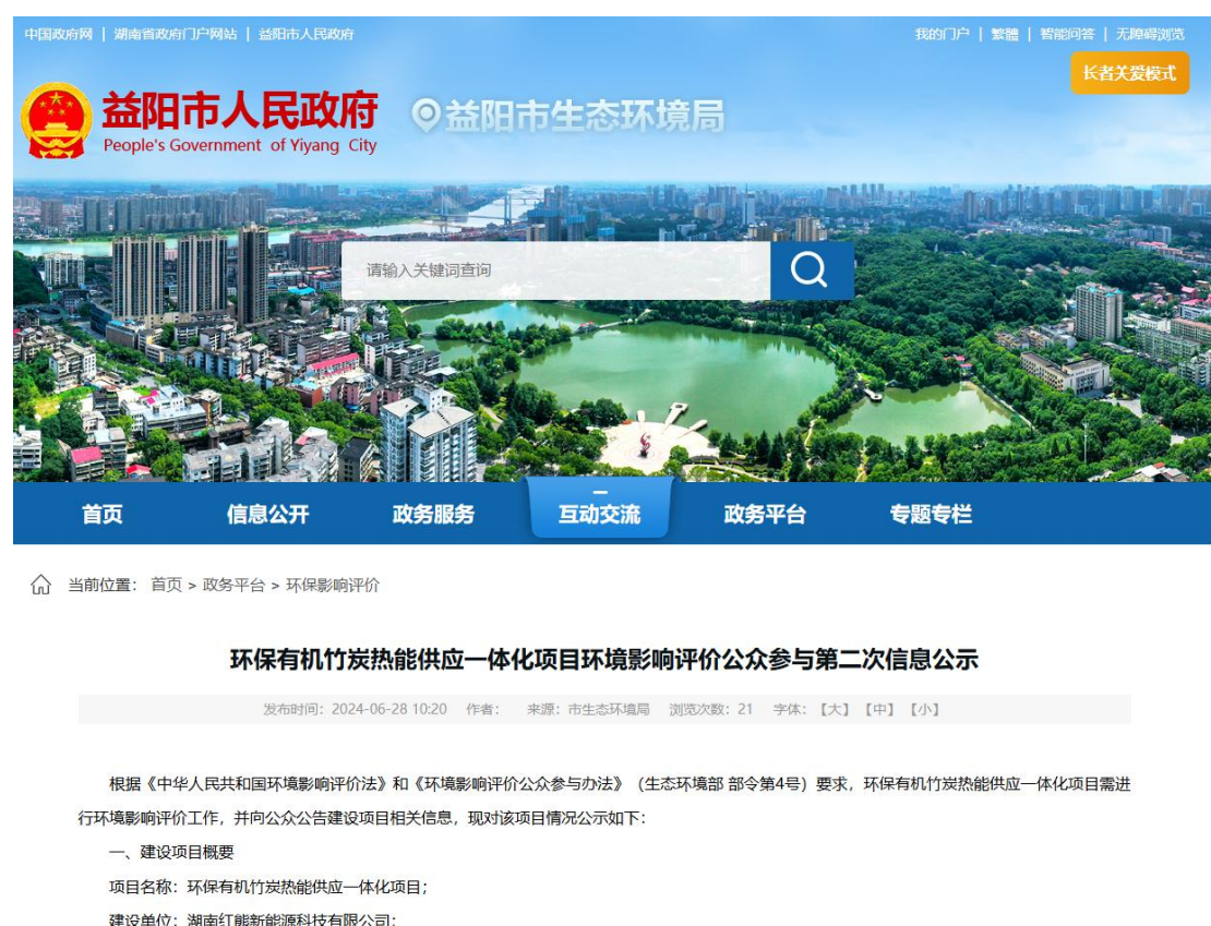
图 3-1 第二次网络公示截图

本项目环境影响报告书征求意见信息公开在“益阳市生态环境局”进行公示，符合《环境影响评价公众参与办法》中规定的网络平台的要求。