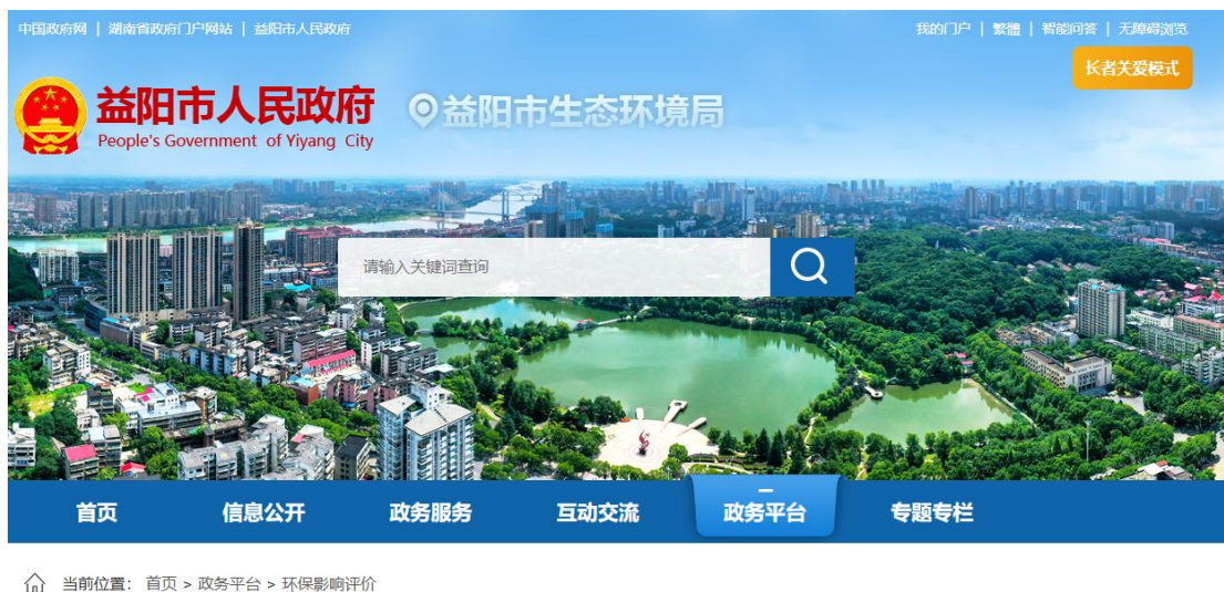
图 2-1 首次环境影响评价信息公告网上截屏图