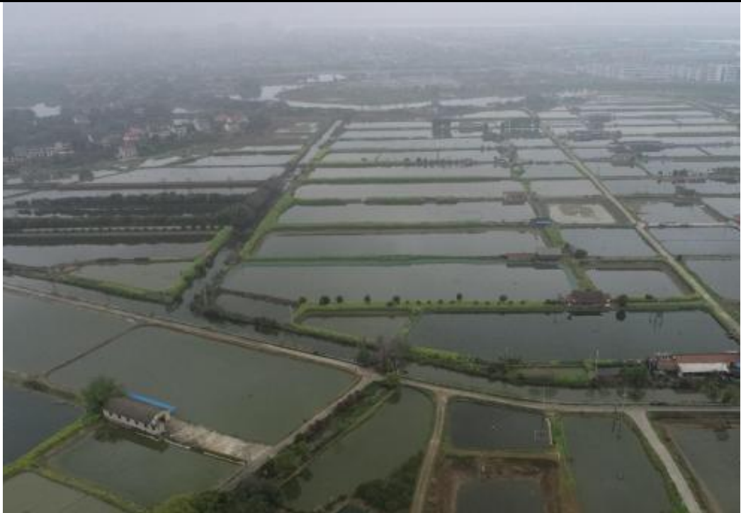
图 3-1 用地现状照片