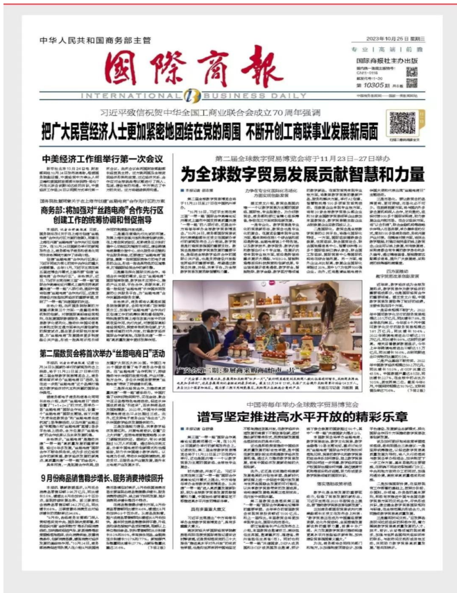
图 3-3 2023 年 10 月 25 日报纸公示

2023年10月24日 星期三 益阳市赫山区新河灌区续建配套与节水改造项目环境影响报告书征求意见稿公示情况 新河灌区位于益阳市赫山区东部,涉及龙光桥、兰溪、笔架山、泉交河、欧江岔、龙岭工业园等6个乡镇,于1977年建成并运行,由于超期服役,续建配套不到位,现对灌区进行续建配套与节水改造。环境影响报告书征求意见稿公示网址链接: https://www.eiacloud.com/gs/detail/1?id=31013HrcnD 环境影响评价范围内的公民、法人和其他组织可在网络平台公示期10个工作日内提出您的宝贵意见和建议。本次为环境影响报告书征求意见稿第一次报纸公示。 环评公示 1、项目名称:北京大兴国际机场临空经济区(廊坊)科技创新区永清临空北再生水厂工程项目 2、建设单位:河北临空集团有限公司 3、建设地点:廊坊市永清县,翔瑞路以东、王泊自排渠以西,一纬路以北。 4、环境影响报告书征求意见稿的网络链接及查阅纸质报告书的方式和途径。 链接: https://gongshi.qsyhbqj.com/h5public-detail?id=359057 5、征求意见的公众范围:谭其营村、郭家务村、曹庄村、东桑园村、刘家务村、大仲和村、小仲和村、天圆养生苑、天圆香漫里、荣盛紫竹苑、大良村、永清县第五中学、益田翰德学校等。