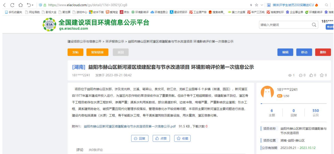
图 2-1 第一次公示网络截图