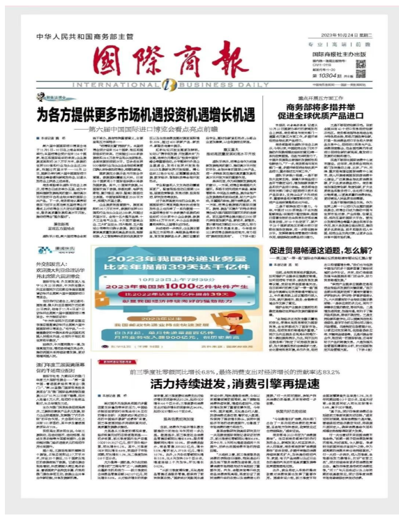
图 3-2 2023 年 10 月 24 日报纸公示

2023年10月24日 星期三 益阳市赫山区新河灌区续建配套与节水改造项目环境影响报告书征求意见稿公示情况 新河灌区位于益阳市赫山区东部,涉及龙光桥、兰溪、笔架山、泉交河、欧江岔、龙岭工业园等6个乡镇,于1977年建成并运行,由于超期服役,续建配套不到位,现对灌区进行续建配套与节水改造。环境影响报告书征求意见稿公示网址链接: https://www.eiacloud.com/gs/detail/1?id=31013HrcnD 环境影响评价范围内的公民、法人和其他组织可在网络平台公示期10个工作日内提出您的宝贵意见和建议。本次为环境影响报告书征求意见稿第一次报纸公示。 环评公示 1、项目名称:北京大兴国际机场临空经济区(廊坊)科技创新区永清临空北再生水厂工程项目 2、建设单位:河北临空集团有限公司 3、建设地点:廊坊市永清县,翔瑞路以东、王泊自排渠以西,一纬路以北。 4、环境影响报告书征求意见稿的网络链接及查阅纸质报告书的方式和途径。 链接: https://gongshi.qsyhbqj.com/h5public-detail?id=359057 5、征求意见的公众范围:谭其营村、郭家务村、曹庄村、东桑园村、刘家务村、大仲和村、小仲和村、天圆养生苑、天圆香漫里、荣盛紫竹苑、大良村、永清县第五中学、益田翰德学校等。