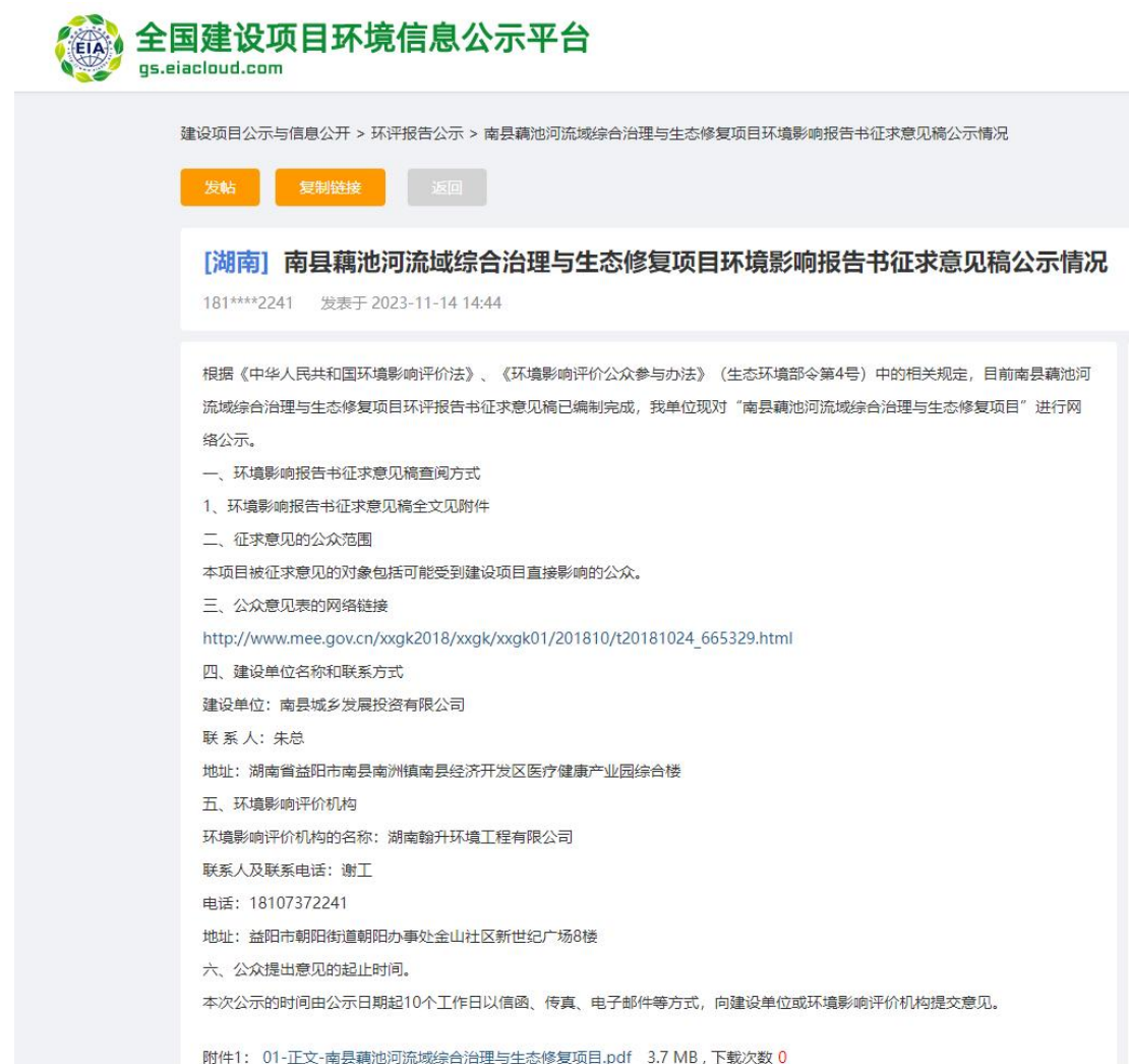
图 2 第二次网上公示截图

根据《环境影响评价公众参与办法 生态环境部令 第 4 号》第十条规定建设项目环境影响报告书征求意见稿形成后，应对征求意见稿及其它相关信息进行公示。第十一条规定公开的信息的方式之一是通过网络平台公开，且持续公开期限不得少于 10 个工作日。因此建设单位在生态环境公示网上进行了此项目的第二次网上公示，公开网址为 https://www.eiacloud.com/gs/detail/1?id=31114rz4Xm ，公示截图见图 2 所示。因此，公开载体的选取是符合《环境影响评价公众参与办法 生态环境部令 第 4 号》第十一条的规定。