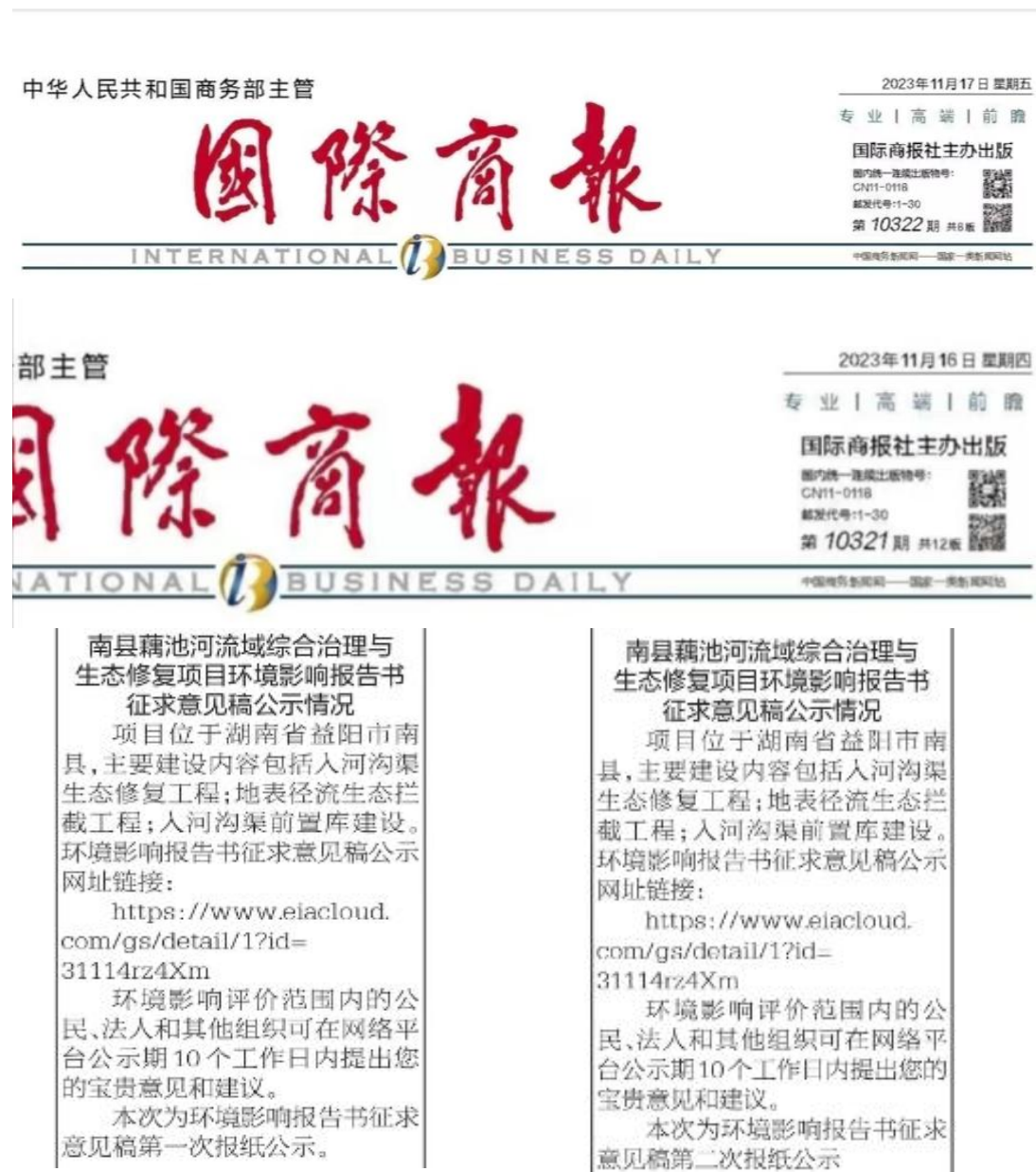
图4 环境影响报告书征求意见稿第二次报纸公示截图