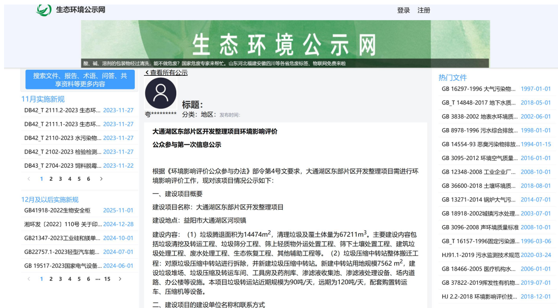
图 1 第一次网上公示截图