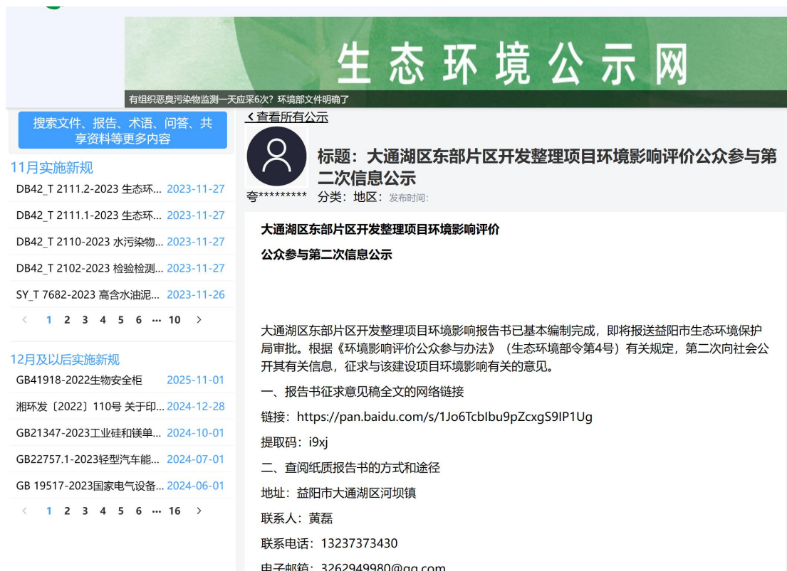
图2 第二次网上公示截图