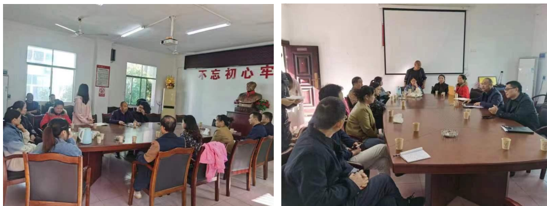
图 4 群众座谈会