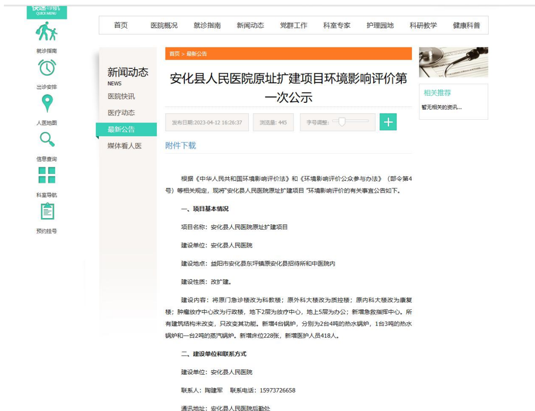
图3 第一次网上公示截图——安化县人民医院官网