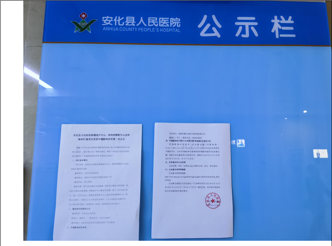
图 7 征求意见稿形成后现场张贴公示情况

征求意见稿形成后，在项目所在地（安化县人民医院）进行了现场张贴公示，公示情况详见图 6。