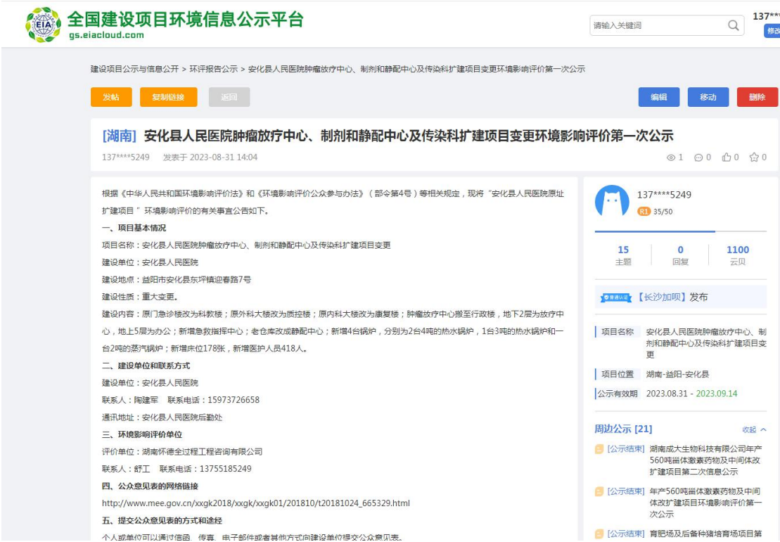
图 2 第一次网上公示截图——建设项目环评公示网

第一次公众参与网络公示分别于 2023 年 8 月 31 日在环评互联网（ https://www.eiacloud.com/gs/detail/1?id=30831NMDpT ）、2023 年 9 月 4 日安化县人民医院官网（ http://www.ahxrmmy.com/news/show-2852.aspx ）开展。