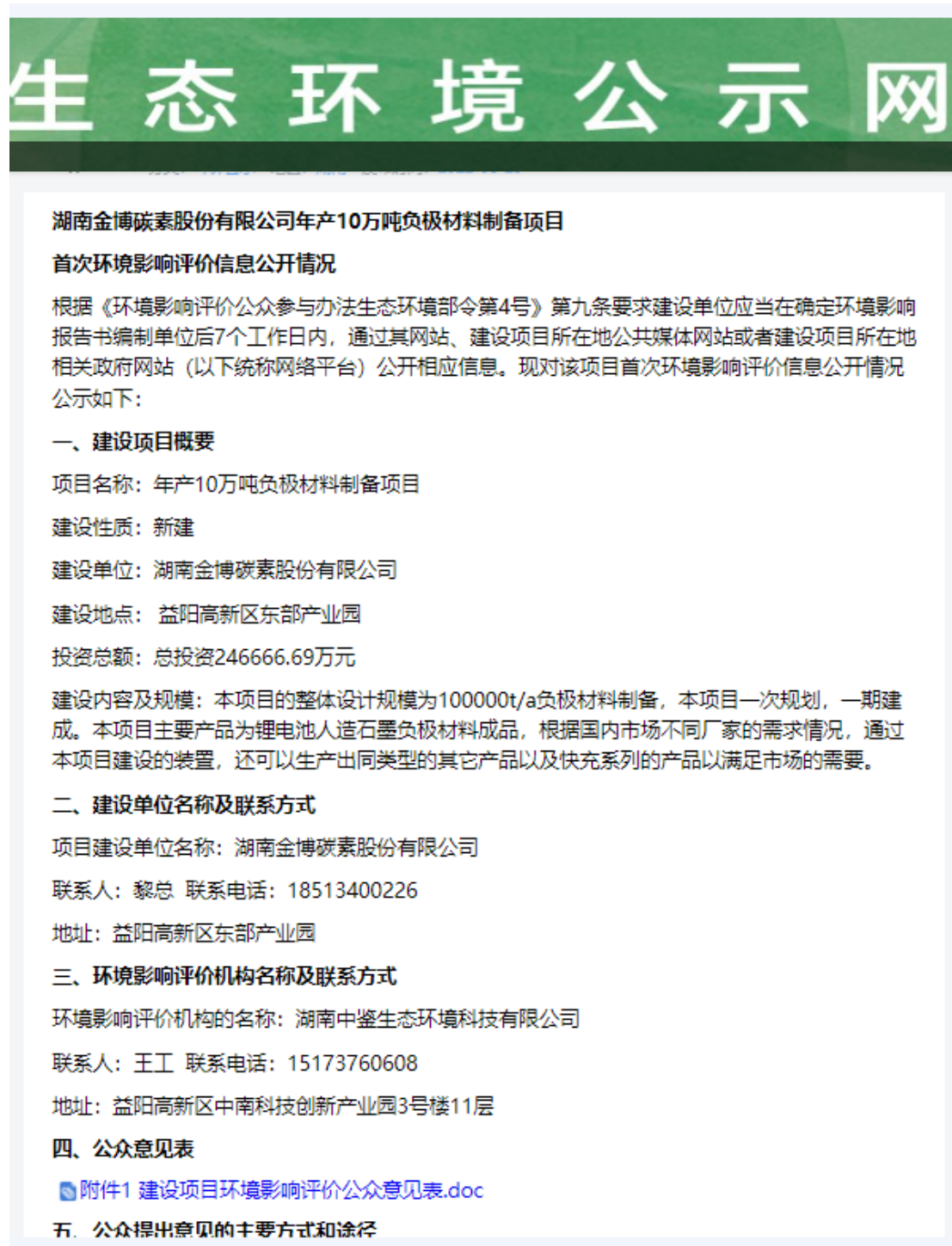
图1 第一次网上公示截图