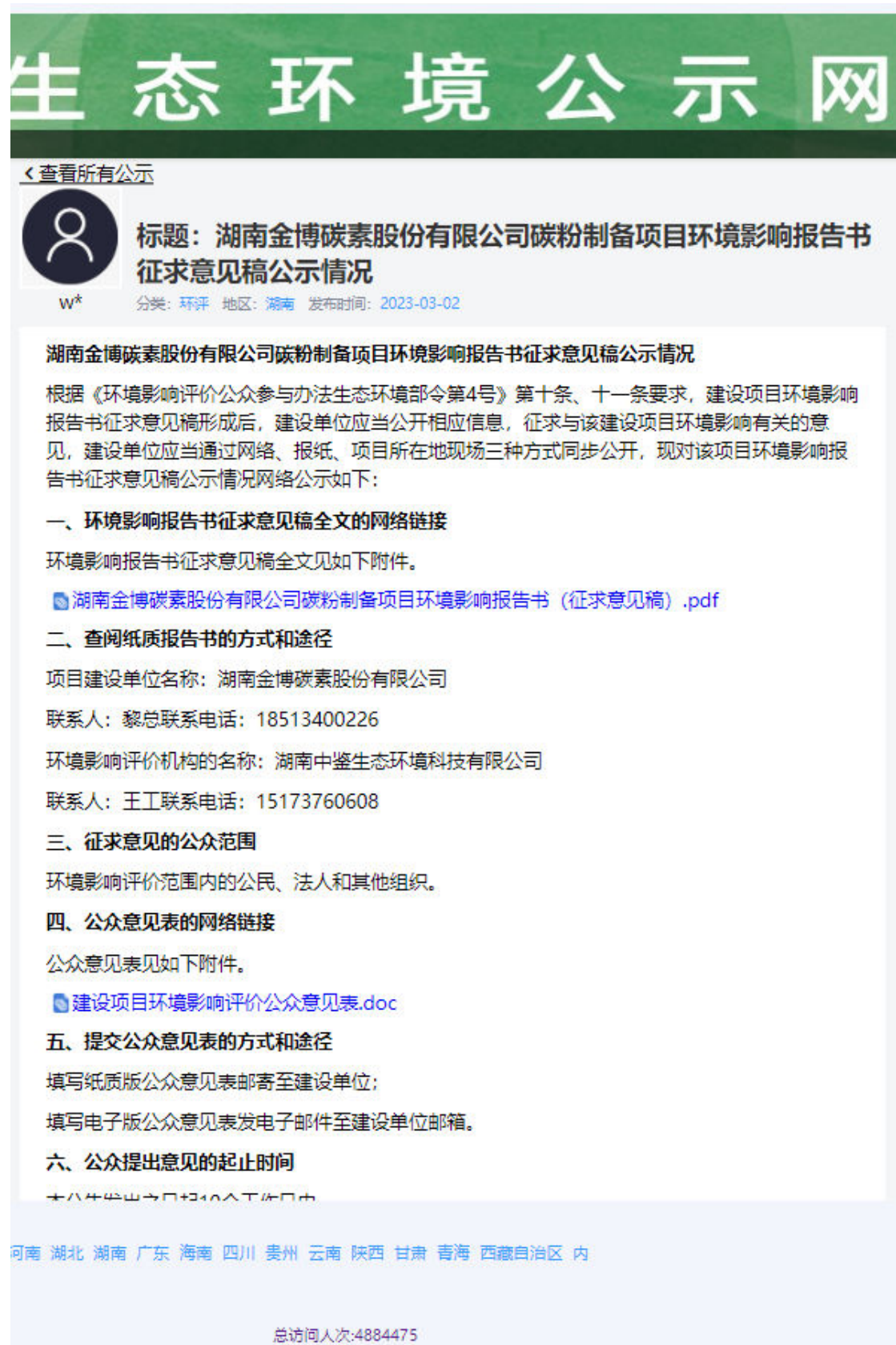
图2 第二次网上公示截图