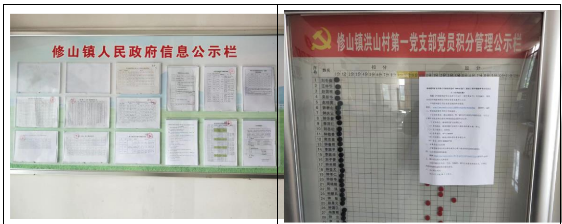
图 3.2-3 张贴告示

建设方在桃江县修山镇人民政府、桃江县修山镇洪山村张贴了公告公示，以上场所为人流量较大的公共区域，便于公众接触和信息传播，可以作为本项目张贴公告的场所。