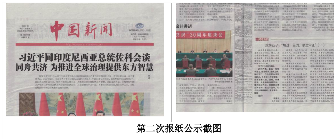
图 3.2-2 两次报纸公示截图