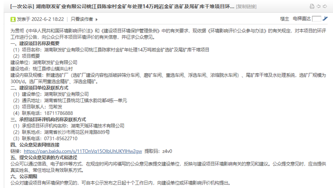
图 2.2-1 第一次网络公示截图