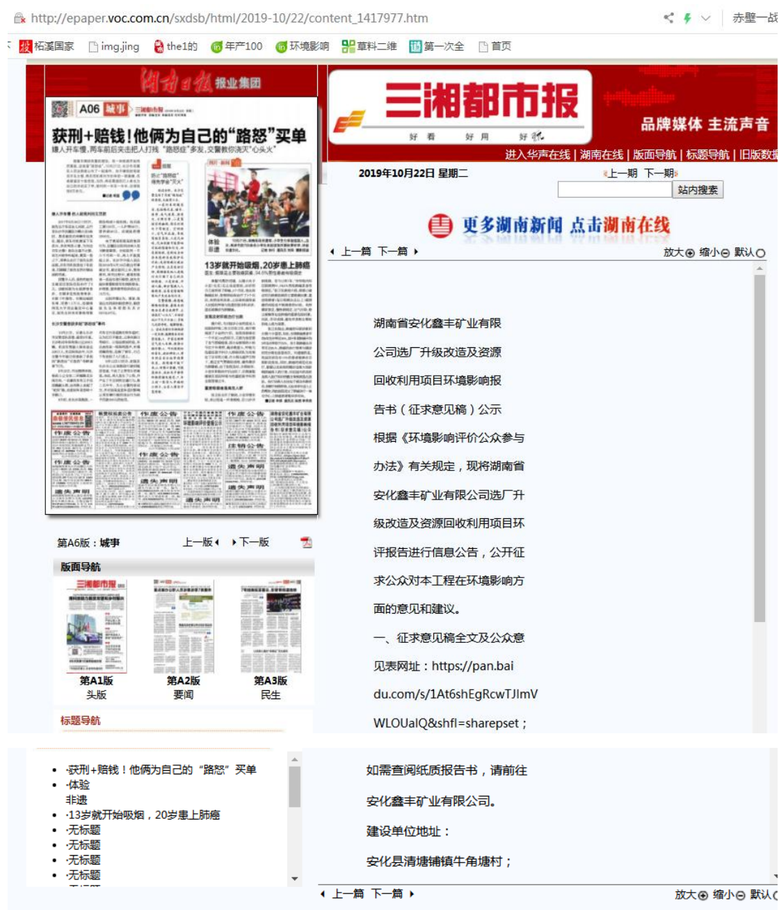
图 3.2-1 网络公示

http://epaper.voc.com.cn/sxdsb/html/2019-10/29/content_1419366.htm?di v=-1 ；网上公示截图见图 3.2-1。