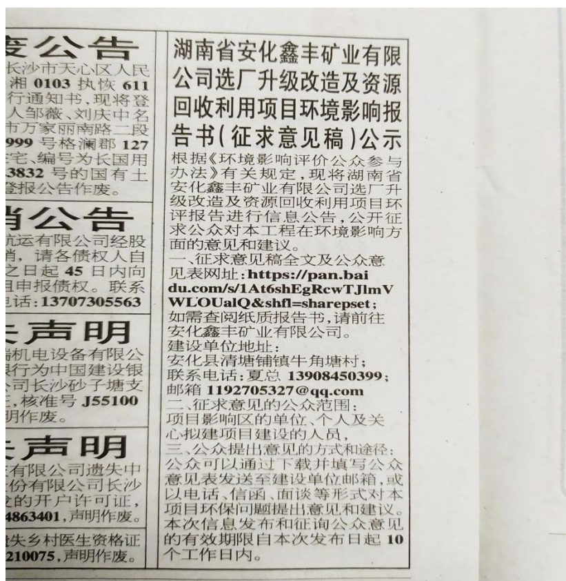
图 3.2-3 报纸公示