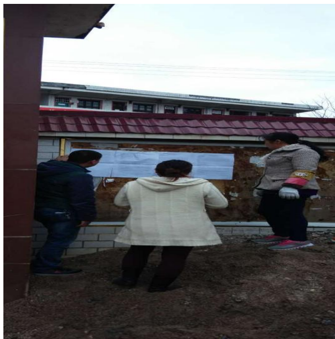
图 2.2-2 现场公示

建设单位于 2019 年 7 月 19 日~7 月 31 日，以公告的形式在项目所在地清塘铺镇进行公示，现场公示见图 2.2-2。