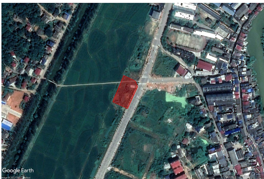
调查区域 2017 年历史影像