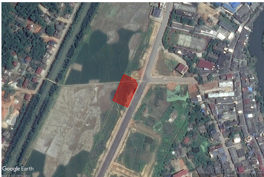
调查区域 2015 年历史影像图