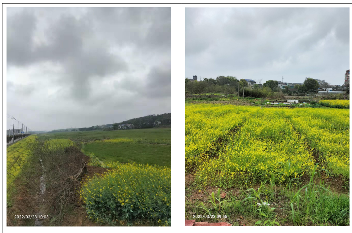
图 3.3-1 调查区域现状

地块周边主要为居民居住区，益阳市第十七中学，目前地块为已完成部分元亮地产多层商住楼建设，根据调查结果本调查地块周边主要为居民宅基地及农用地。