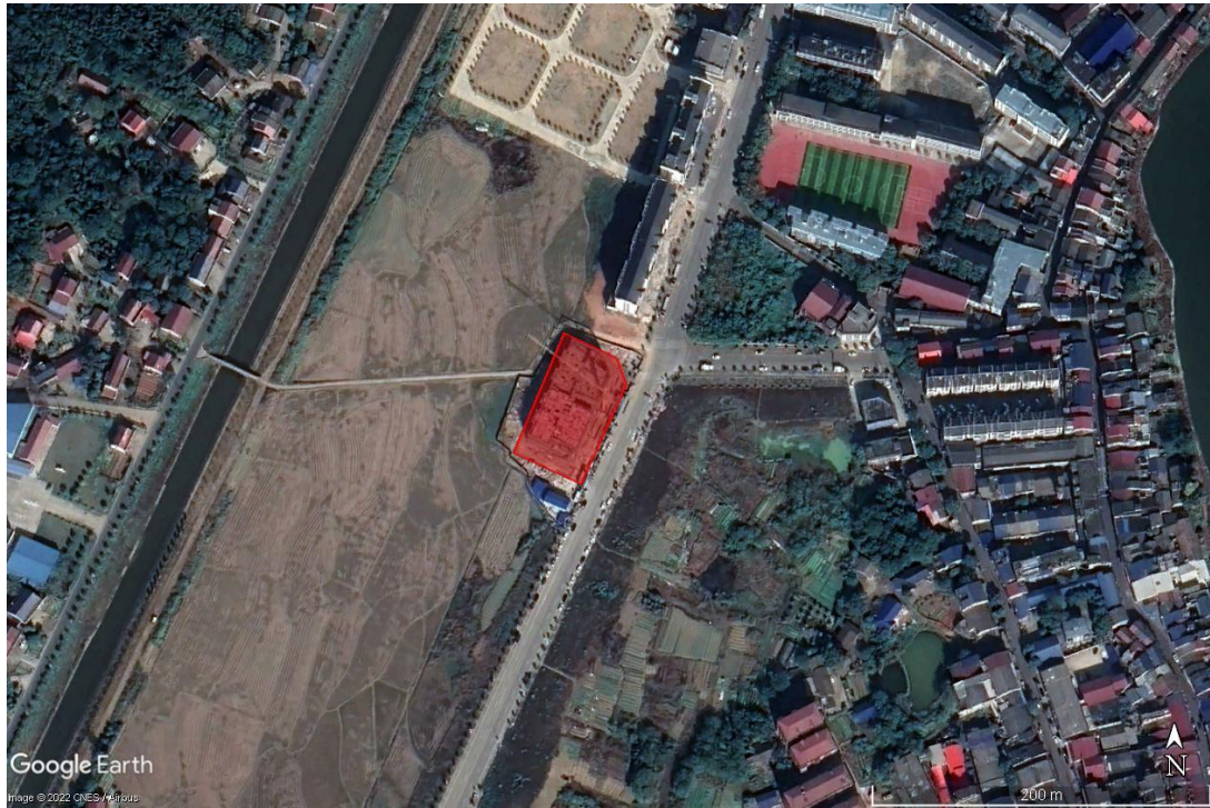
调查区域 2021 年场地现状影像图