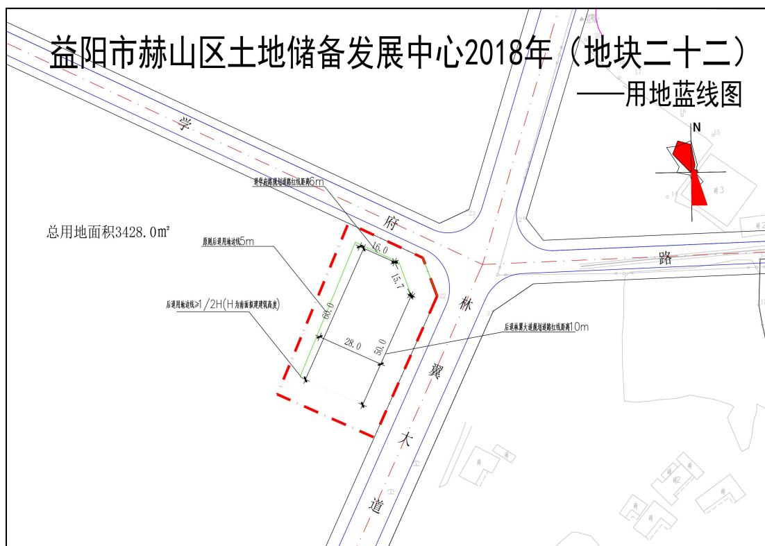
图 2.2-1 调查范围蓝线图