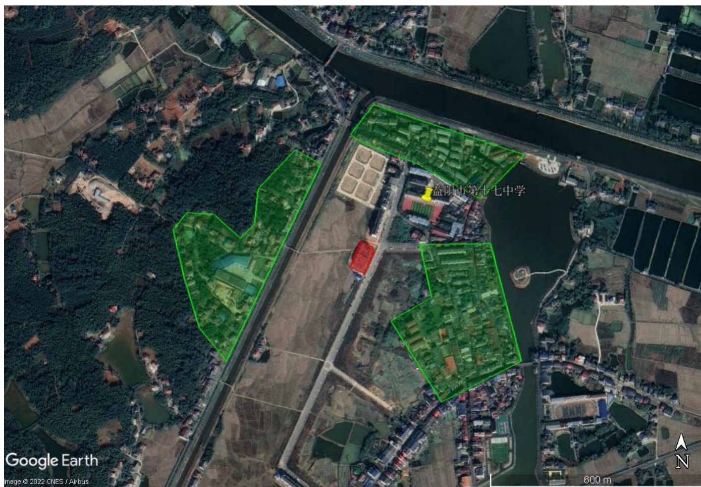
图 3.1-1 场地周边环境图