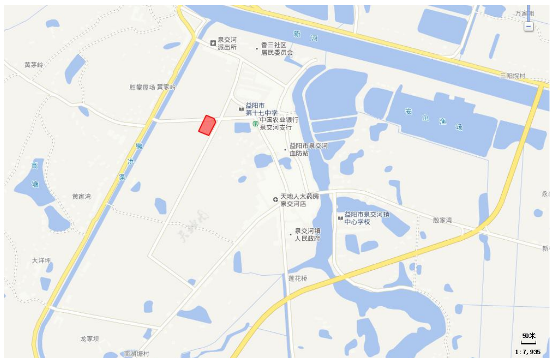
图 3.1-1 项目所在地理位置图

调查地块位于益阳市赫山区泉交河镇，中心坐标东经 112°31′7.08″，北纬 28°29′2.87″，总面积约为 3428m 2 （5.14 亩），场地四周主要为：北侧居民居住区域及益阳市第十七中学，东侧为居民居住区域，西侧及南侧均为农用地。地理位置见图 3.1-1。