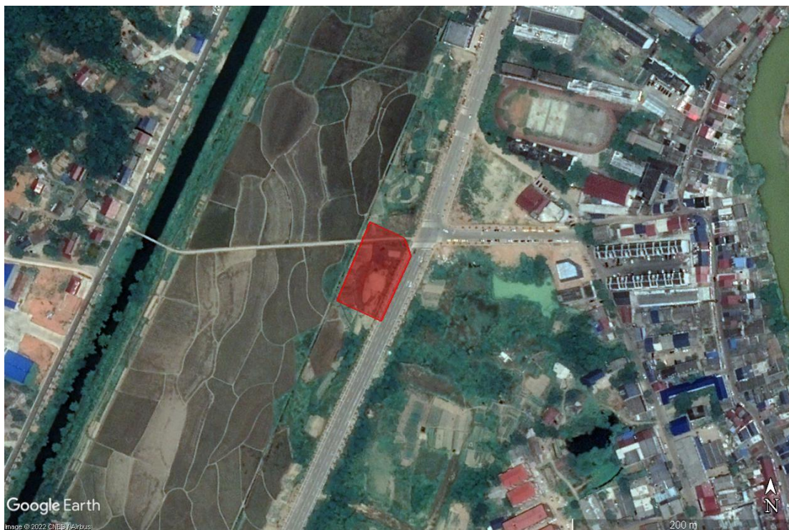
调查区域 2018 年历史影像图