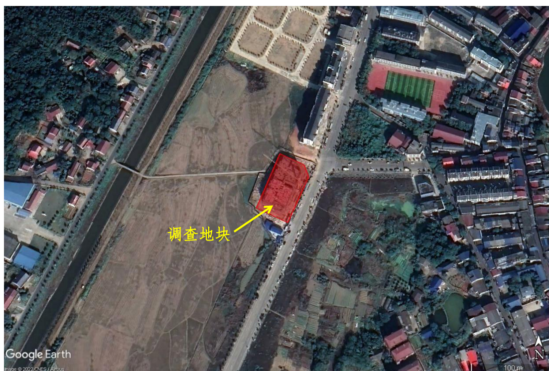
图 2.2-2 调查范围卫星图