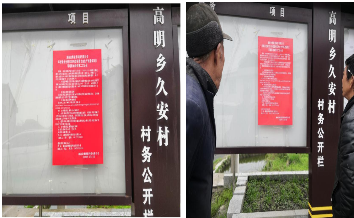
图5 公众参与第二次公示照片（张贴公告）

我单位于 2020 年 4 月 25 日在高明乡久安村以张贴方式进行现场公示, 详见图 5。