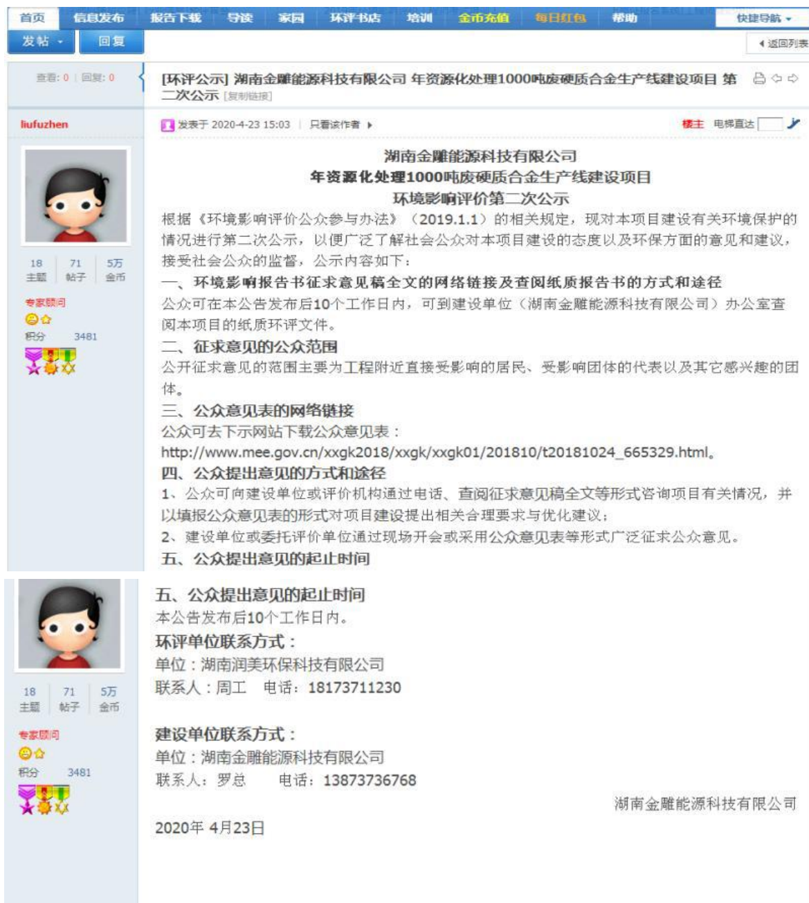
图2 公众参与第二次公示照片（网络）