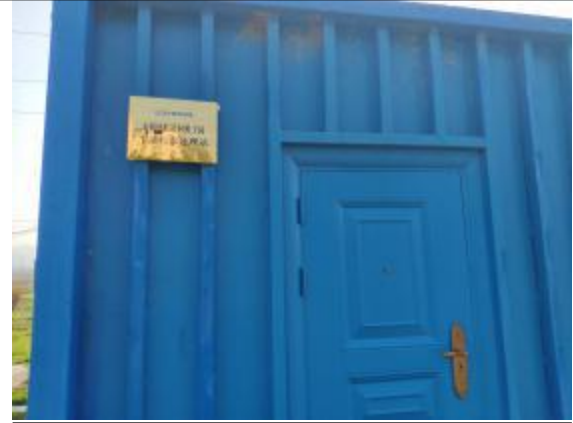
安源镇跃进村柑子园生活污水处理站