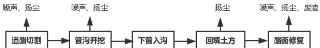
图5-2 管网铺设施工期工艺流程图