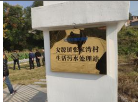
安源镇张家湾村生活污水处理站