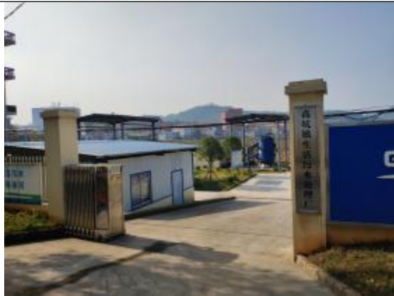
高坑镇污水处理站