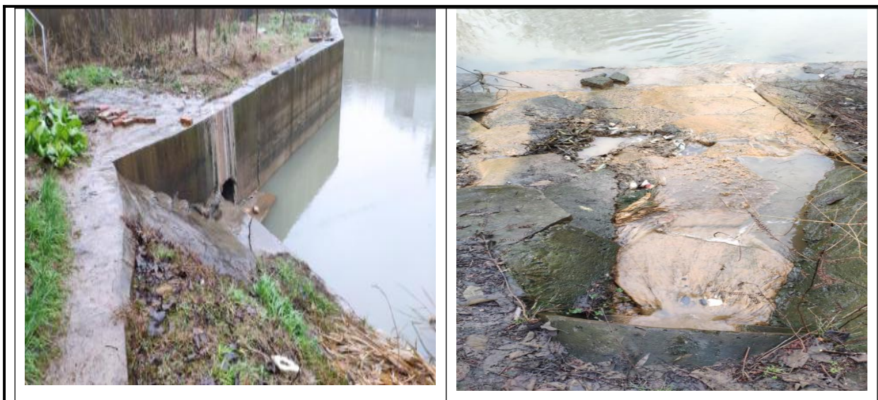
图 1-2 黄茅洲镇污水排放现状图