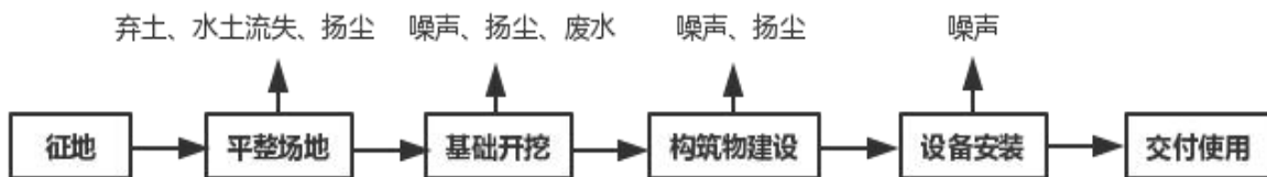
图 5-1 污水处理站厂区施工期工艺流程图

施工期的污染环节主要为厂区和管网铺设产生的污染，其主要工艺及产物流程如图5-1、图5-2所示。