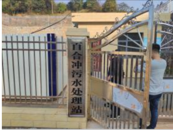
百合冲污水处理站