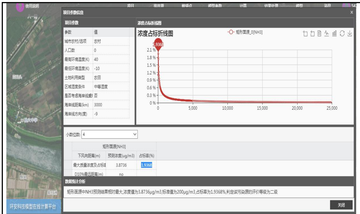
图 7-1 项目废气污染物估算模式计算结果图

根据计算结果，在正常工况下，项目废气排放中的大气污染物中最大超标率为1.9368%。根据导则判定，本项目大气环境影响评价等级为二级评价。根据《环境影响评价技术导则—大气环境》HJ2.2-2018 要求“二级评价项目不进行进一步预测与评价。”评价范围为以项目为中心，边长 5km 的矩形范围内。