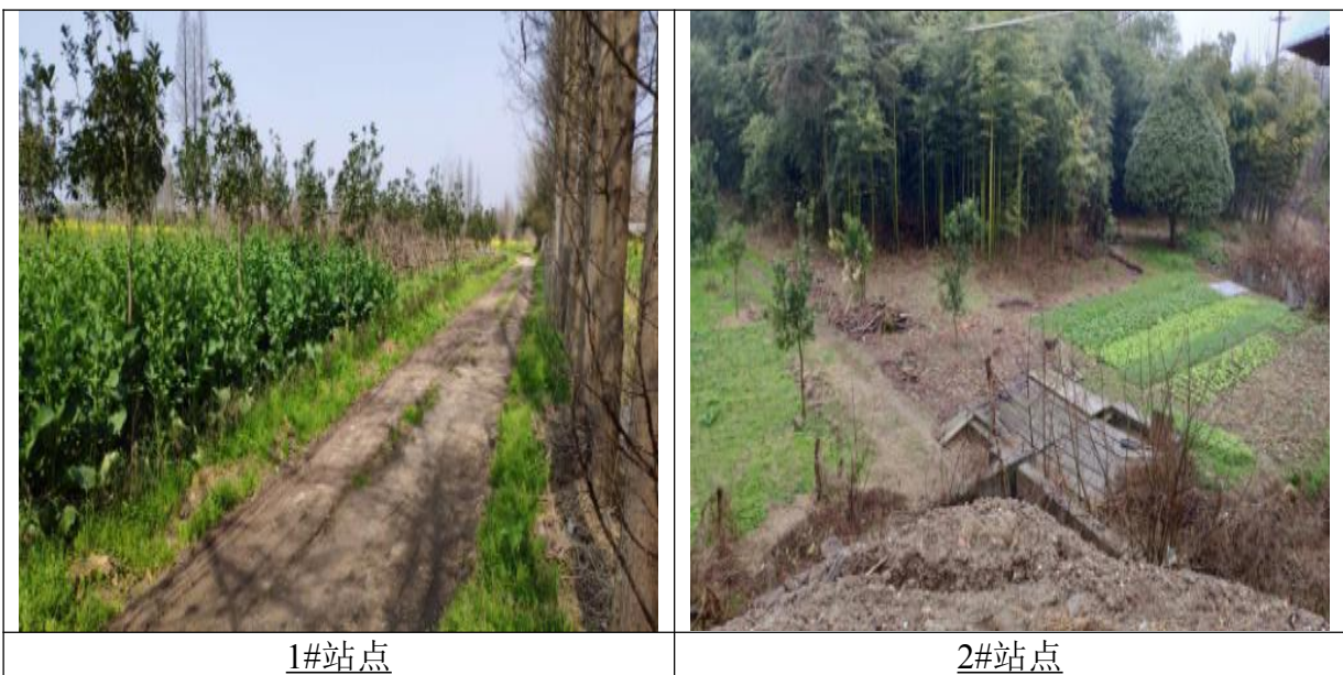
图 1-1 黄茅洲镇污水处理站厂址现状照片

本工程厂区总平面布置的原则是： 根据周边情况，各专业统一规划，合理进行平面布局；根据自然条件合理布局以使流程顺畅，尽可能减少土方工程量以节省工程投资；符合环境保护要求；竖向设计充分考虑场地及周边实际情况，合理排出雨水，尽量减少总水位差；合理布局管线，在满足工艺流程顺畅、简洁、合理的前提下，力求布局紧凑，管线短捷，尽量少交叉，并充分注意节省占地；人流、物流运输便捷，主次道路分工明确，满足消防要求。 污水处理站厂址现状照片见图 1-1。