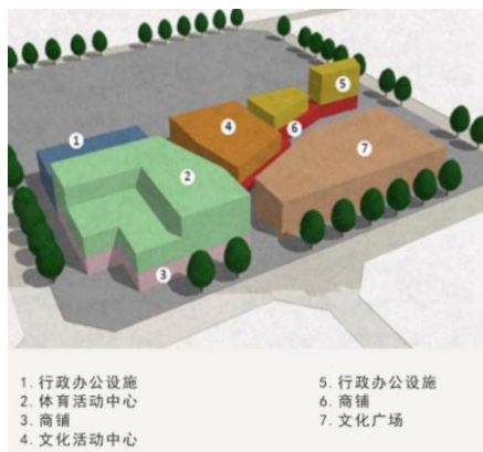
平面式布局示意图