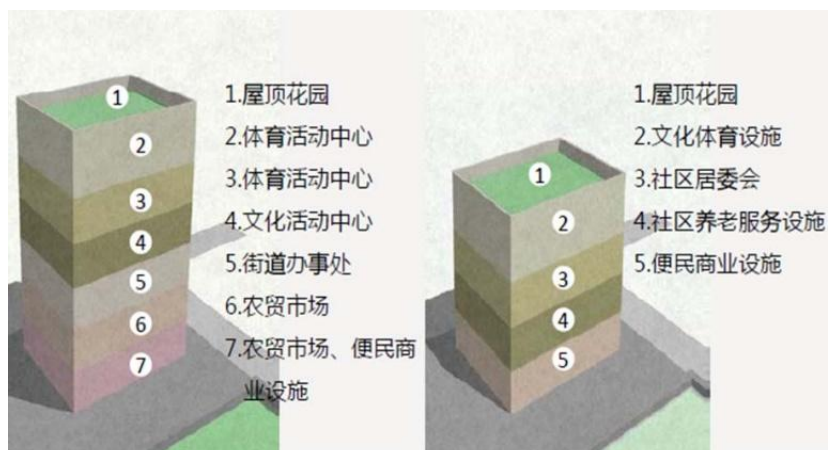
垂直式布局示意图